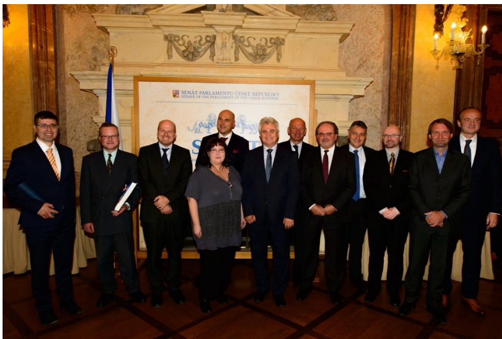
Společná fotografie všech oceněných ze Senátu PČR