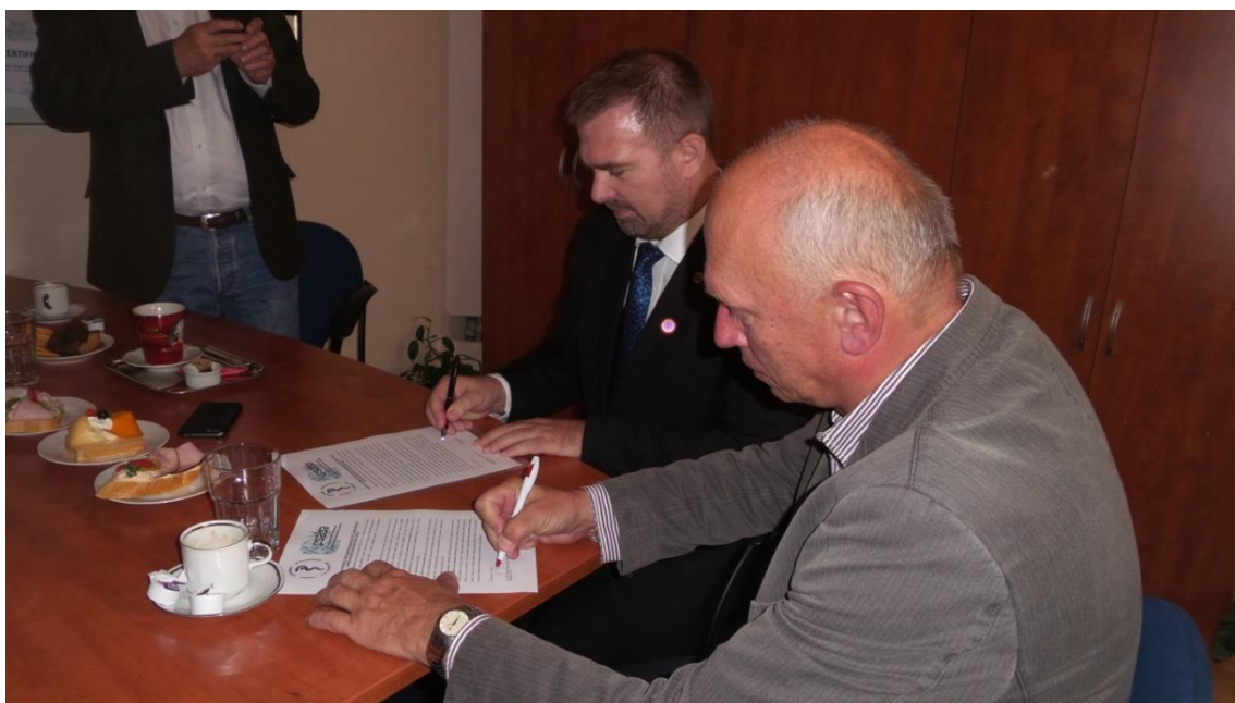
Fotografie z podepisování společného prohlášení předsedy ČLS JEP a ČSABA