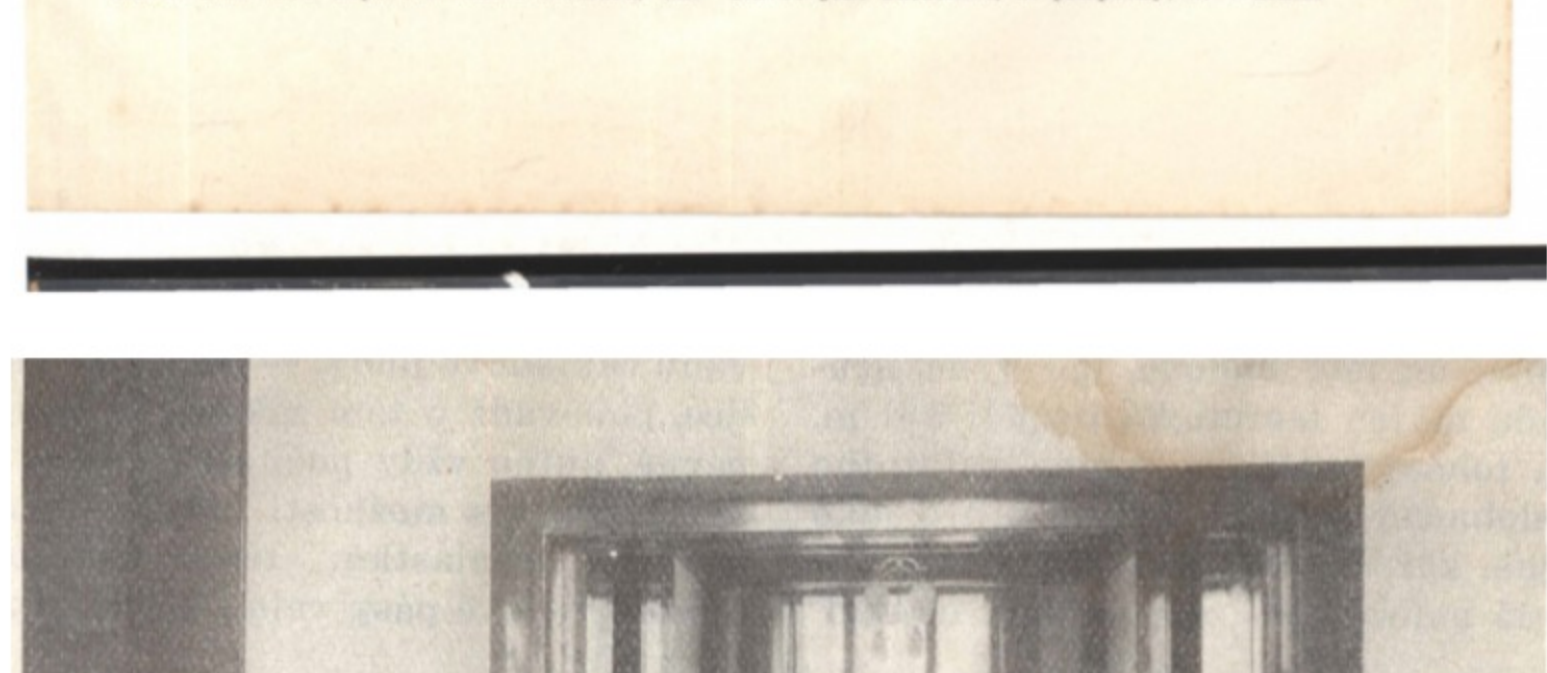
Dobová fotografie náměstí I. P. Pavlova